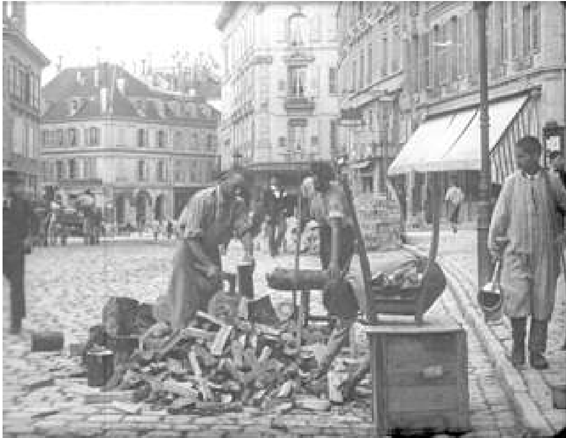
Saint-François tiré des collections Lumière

- Ce soutien rappelle un autre partenariat que l'AML a développé avec la Cinémathèque suisse . En 2014, l'AML avait proposé de projeter des films d'archives sur Lausanne au cinéma Capitole. Cette opération avait même dégagé un petit bénéfice qui avait été affecté au développement d'un projet de DVD. Grâce à la Cinémathèque, ce projet a pu aboutir cinq années plus tard et, pour la sortie du DVD, la Cinémathèque a organisé un vernissage avec projection d'extraits au cinéma Capitole.